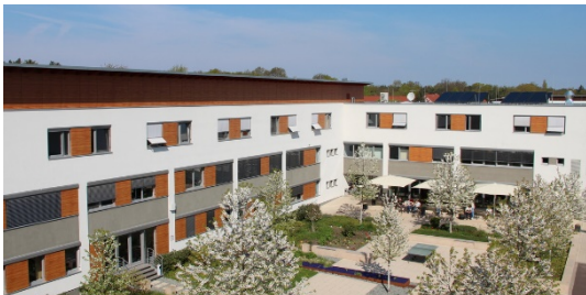
Bildungsstätte für den Justizvollzug