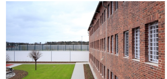
JVA Brandenburg an der Havel

Nach 3-jähriger Bewährung erfolgt regelmäßig die Verbeamtung auf Lebenszeit .